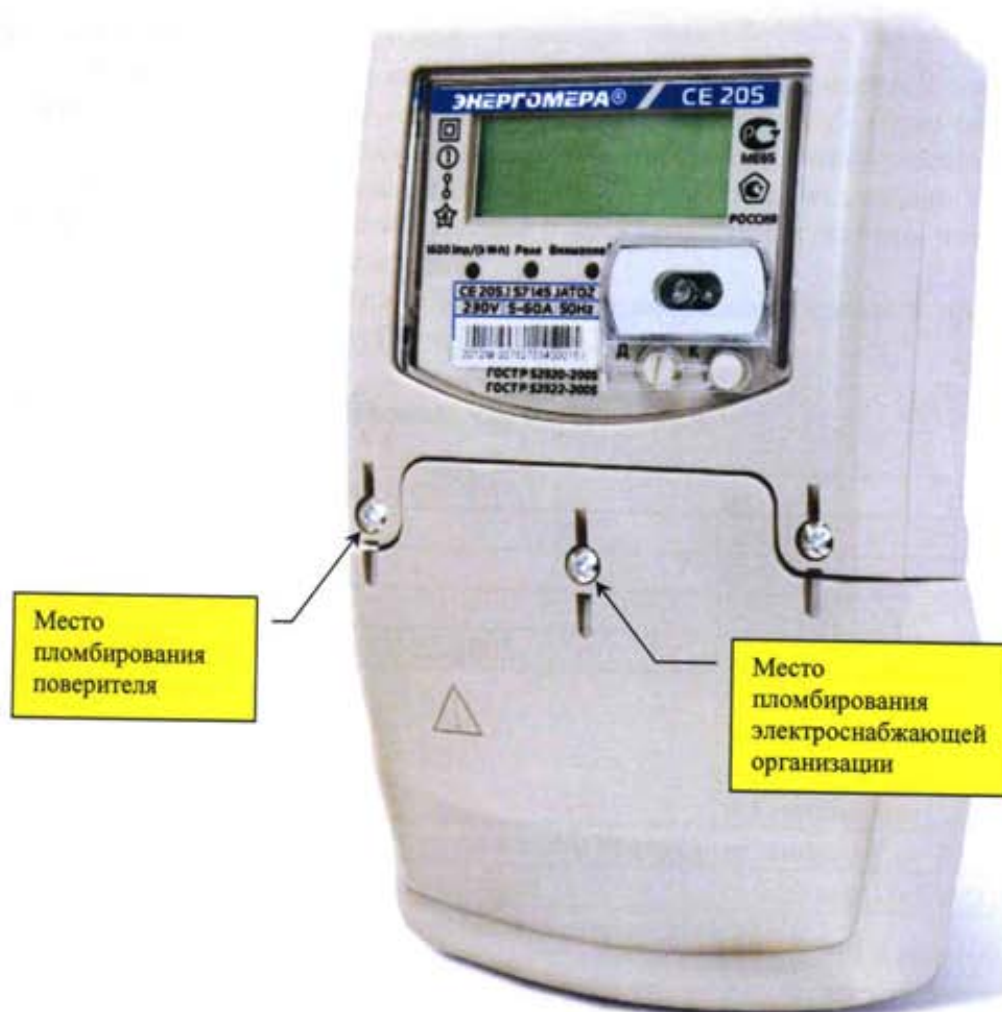
Рисунок 2 – Общий вид счётчика CE 205