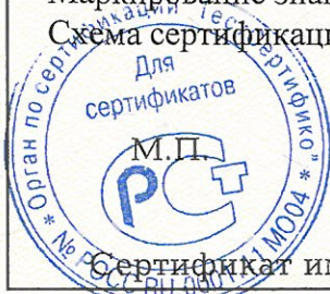
Схема сертификации: 3.

Маркирование знаком соответствия по ГОСТ Р 50460-92.